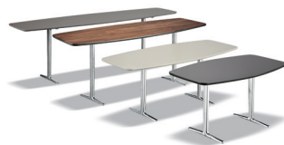
5 WILSON CONSOLLE CM 150X50 H45