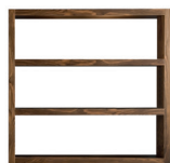
8 JOHNS LIBRERIA CM 180X40 H174